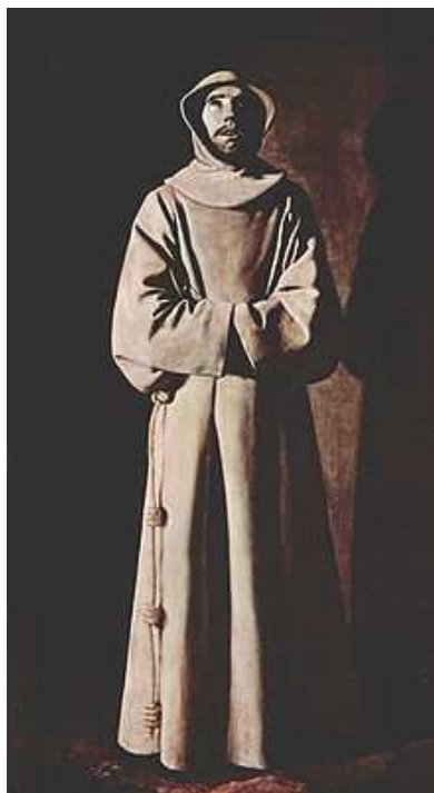
Saint François d'Assise, Francisco de Zurbarán, Musée des Beaux-arts de Lyon.

Collecte de la messe de saint François d'Assise