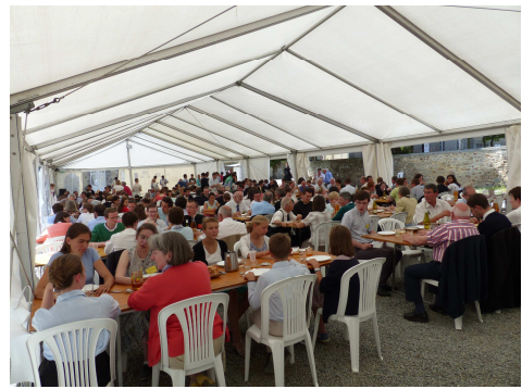
Du réconfort stomacal...